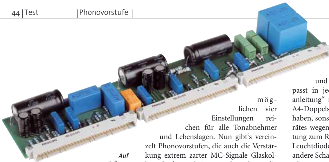
Auf zwei dieser Steckmodule ist die Verstärkerschaltung untergebracht – von den Röhren abgesehen

möglichen vier Einstellungen reichen für alle Tonabnehmer und Lebenslagen. Nun gibt's vereinzelt Phonovorstufen, die auch die Verstärkung extrem zarter MC-Signale Glaskolben überlassen, beim PTP übernehmen die Trafos die ersten 12 bis 24 Dezibel (je nach Verstärkungseinstellung). Anders, so der Hersteller, wäre ein hinreichend geringer Rauschpegel und eine ausreichende Mikrofonie-Unempfindlichkeit einfach nicht zu realisieren. Alle Übertrager fertigt man natürlich selbst, über Wickelschema und Kernmaterialien der Spezialisten zeigt man sich verständlicherweise wenig auskunftsfreudig. Jedenfalls lässt sich jetzt die Beschaltung des linken, extrem