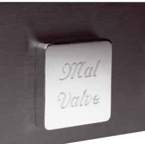
Wer so groß baut, braucht auch beim Typenschild nicht zu kleckern. Das des preamp three phono ist eher ein Klotz denn ein Schild

satt klackenden (richtig, die Schaltwerke fertigt man ebenfalls zum größten Teil selbst) Drehschalters erklären: Die Positionen eins bis vier schalten MM und MC mit drei Verstärkungen für die erste Eingangsgruppe durch, die Positionen fünf bis acht das Gleiche für die zweite Gruppe. Der kleine Drehknopf links daneben offenbart eine weitere Besonderheit: Mit ihm kann man nämlich zwischen einer RIAA-normgemäßen Hochtonentzerrung mit einer Zeitkonstante von 75 Mikrosekunden und einem weniger bekannten, aber in früheren Jahren gerne verwendeten Wert von 50 Mikrosekunden umschalten. Die rechte Frontplattenhälfte belegen der Netzschalter und zwei Impedanzwahlschalter, einer für jeden Eingang: