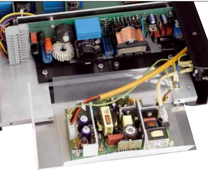
Stromversorgungs-High-tech: Der MalValve wird von einem Schaltnetzteil (hinten) mit „Power Factor Corrector“ (vorne) gespeist

Der PTP ist konsequent symmetrisch aufgebaut und profitiert auch beim eingangs- oder ausgangsseitig unsymmetrischen Anschluss von dieser Architektur. Cinch-Eingangssignale symmetriert ein Übertrager sofort hinter den Eingangsbuchsen, die unsymmetrischen Ausgangssignale generiert ebenfalls ein Trafo aus den symmetrischen Signalen im Inneren. Von daher ist's beim PTP weitgehend egal, womit sie ihn verbandeln – bei ihm läuft immer „das volle Programm“.