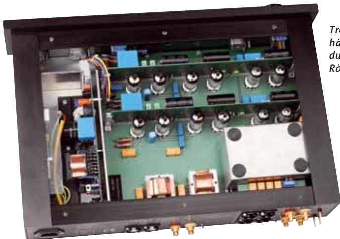
Trotz des voluminösen Gehäuses herrscht im Inneren durchaus keine Leere: Zwölf Röhren bestimmen das Bild

Übertrager finden sich sogar sechs Stück. Die vier Eingangstrafos sitzen auf Steckmodulen unter einer Haube aus hoch abschirmendem MU (magnetisch undurchlässig)-Metall. Vier sind's deshalb, weil MM- und MC-Tonabnehmer so unterschiedliche Anforderungen an die Umspanner stellen, dass man sie schlicht nicht mit einem einzigen realisieren konnte. Unterschiedliche Wicklungsabgriffe an diesen Übertragern bestimmen auch die Gesamtverstärkung des Gerätes, die