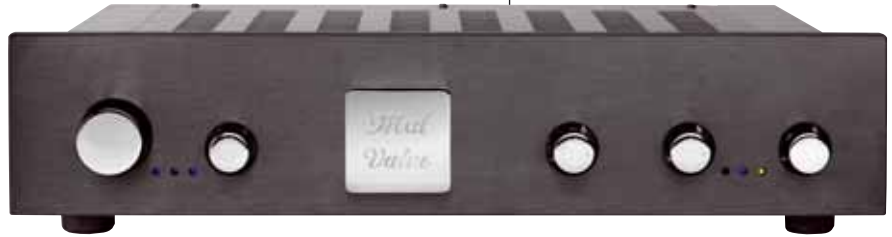
Ein Phonovertärker mit fünf Bedienelementen – bei MalValve geht's komfortabel zu

Es ist nicht weiter wichtig, welche Phono-vorstufe in dieser Situation gerade die Vorverstärkung des Tonabnehmers übernahm. Zu seiner Ehrenrettung sei gesagt, dass er deutlich im dreistelligen Preisbereich angesiedelt war. Was nach dem „Nur-mal-eben-den-MalValve-anstöpseln“ folgte, war ein Erdbeben. Wir reden hier nicht von subtilen Veränderungen, nicht von klanglichen Nuancierungen – der Essener klingt einfach komplett anders. Seine Tonalität baut auf ein überaus mächtiges, eisenhartes Bassfundament auf und wird nach oben hin scheinbar immer leiser. Nicht, dass er keine Höhen reproduzieren würde, aber Wurzel allen Geschehens sind die tiefen Töne. Dass das Phänomen kein kombinationsbedingtes war, zeigten Querchecks mit anderen Tonabnehmern. Der tonale Charakter des PTP blieb dabei stets erhalten: ein ganz strammer, extrem tiefer Bass,